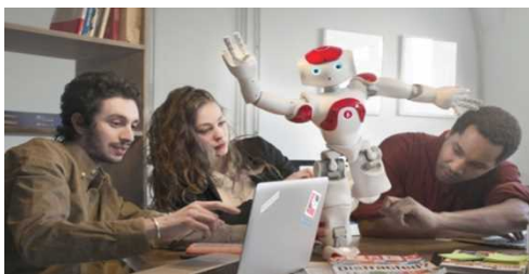
ヒューマノイド型ロボットNAO

NAOはフランスのアルデバラン社が開発。Pepperのもとになったロボットで世界で最も売れているヒューマノイド型ロボット。二足歩行の研究用としてスタート。現在、教育や治療など多様に使われている。